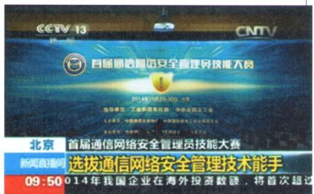
中央电视台新闻频道报道